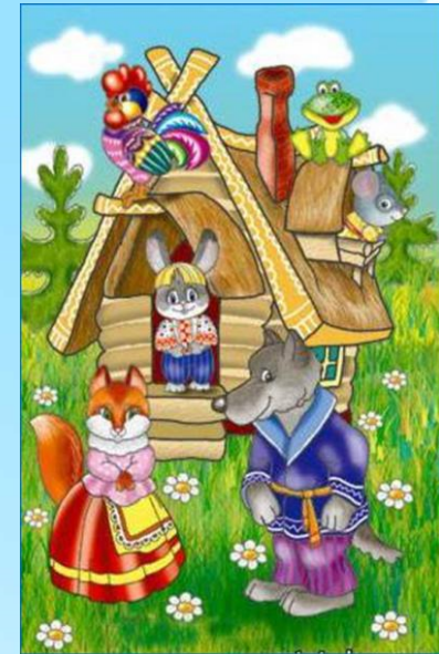
Красочные картинки по сюжету сказки