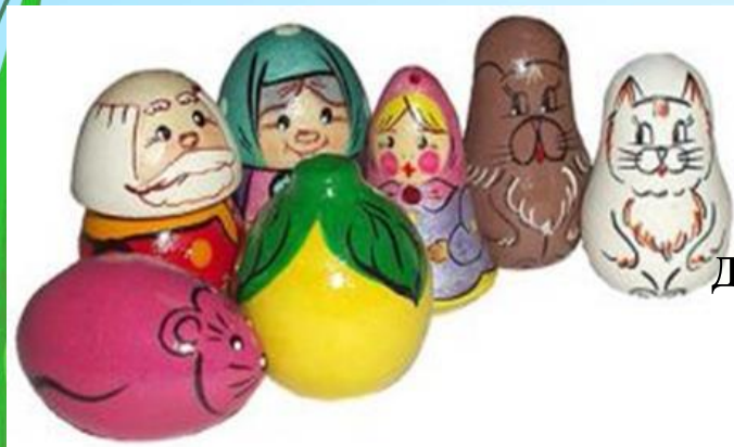
Пластиковые и деревянные персонажи людей