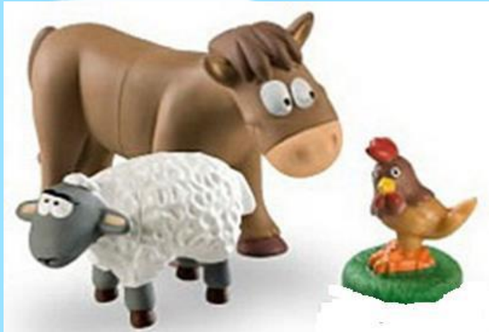
Пластиковые и деревянные персонажи животных