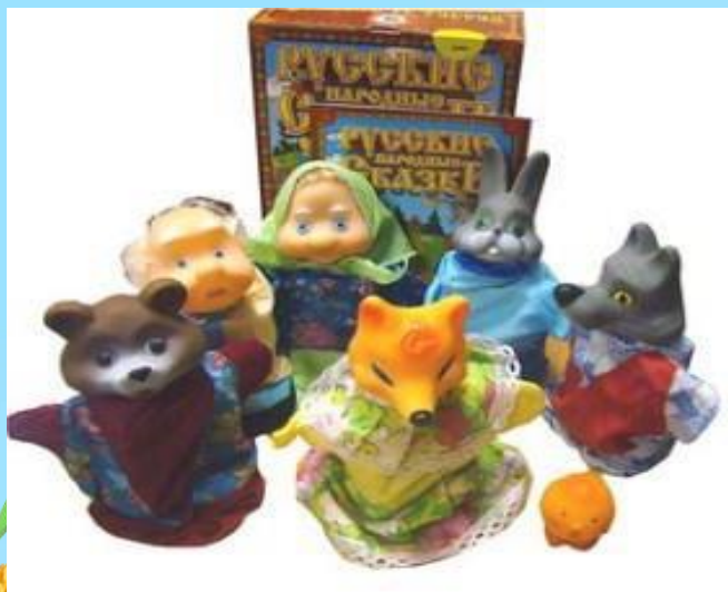
Куклы БиБаБо (перчаточные куклы)